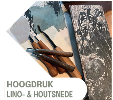
HOOGDRUK LINO- & HOUTSNEDE