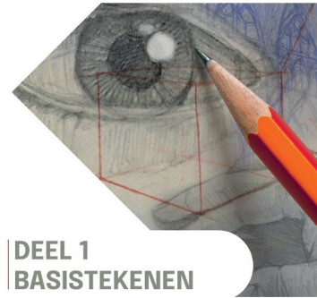
DEEL 1 BASISTEKENEN