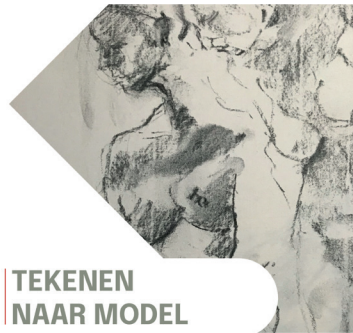
TEKENEN NAAR MODEL