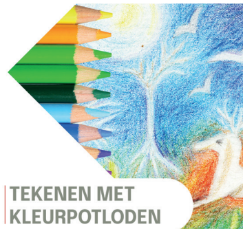
TEKENEN MET KLEURPOTLODEN