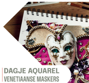
DAGJE AQUAREL VENETIAANSE MASKERS