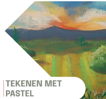
TEKENEN MET PASTEL