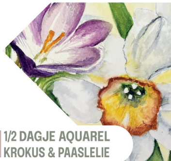
1/2 DAGJE AQUAREL KROKUS & PAASLELIE