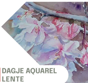
DAGJE AQUAREL LENTE