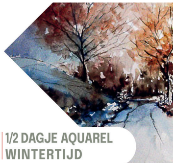
1/2 DAGJE AQUAREL WINTERTIJD