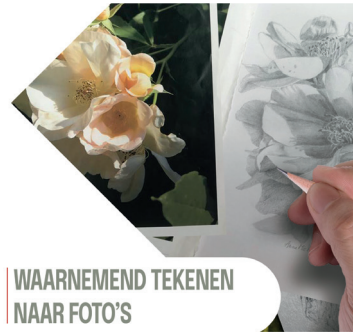
WAARNEMEND TEKENEN NAAR FOTO'S