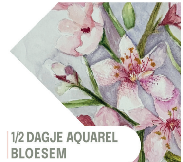
1/2 DAGJE AQUAREL BLOESEM