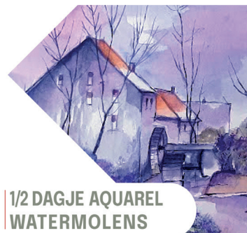
1/2 DAGJE AQUAREL WATERMOLENS